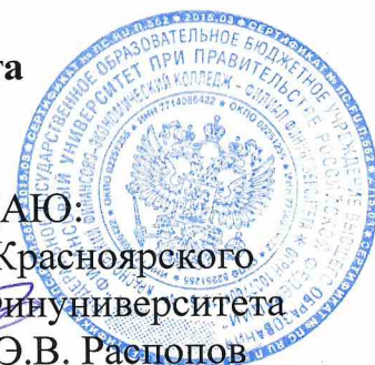
График сдачи дневников о прохождении производственной практики (преддипломной)

для студентов III курса заочной формы обучения по специальностям: